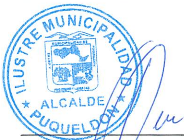
PEDRO MONTECINOS MONTIEL ALCALDE I. MUNICIPALIDAD DE PUQUELDON REGION DE LOS LAGOS

La presente modificación de convenio, se suscribe en 4 ejemplares de igual tenor y fecha, quedando 2 en poder de cada parte.